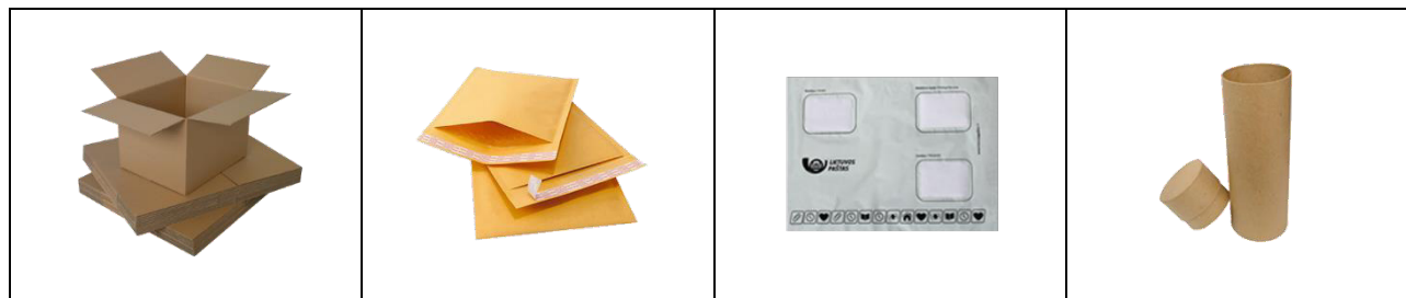
Raukšlėtojo kartono dėžė