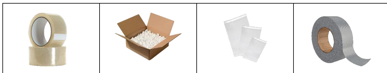
Lipnioji pakavimo juosta